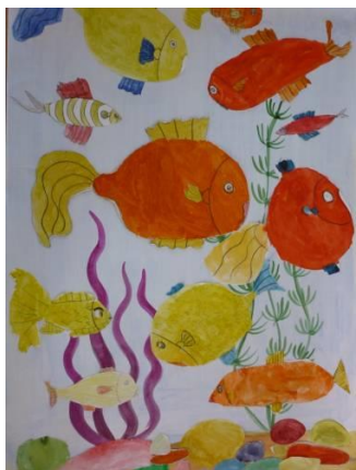
«Рыбки в аквариуме среди водорослей», 2 класс

Именно поэтому необходимо применять в своей работе новые методы обучения, и метод проектов как один из них. Способность выразить свои желания, нужды, попросить о помощи и прореагировать на слова говорящих с ними людей поможет ему войти в большой мир. Эта способность будет тем средством, с помощью которого он сможет адаптироваться в окружающем его мире, научиться жить в нем.