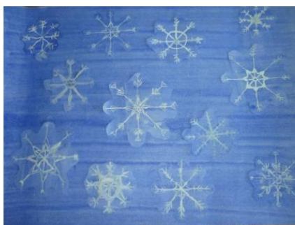
«Снежинки», 4 класс